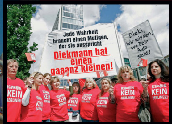
Die Stimmung in der Redaktion ist sehr gut. Und davor auch: Sämtliche Mitarbeiter sind begeistert!

Waaas? Berlin bei Polen? Das glaub' ich nicht!