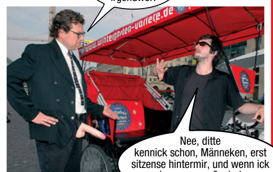
...und beim Fahren...