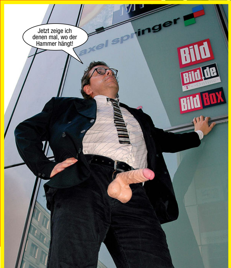
Jetzt zeige ich denen mal, wo der Hammer hängt!