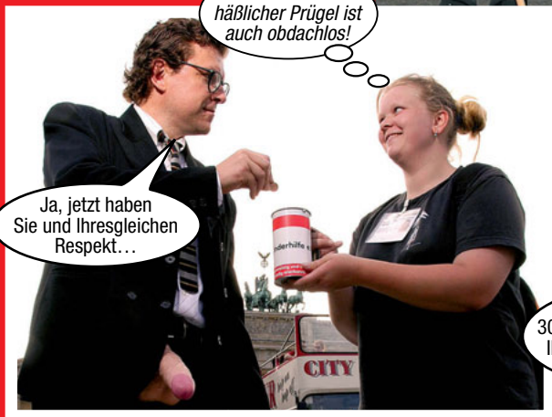
Der Arme! Sein häßlicher Prügel ist auch obdachlos!