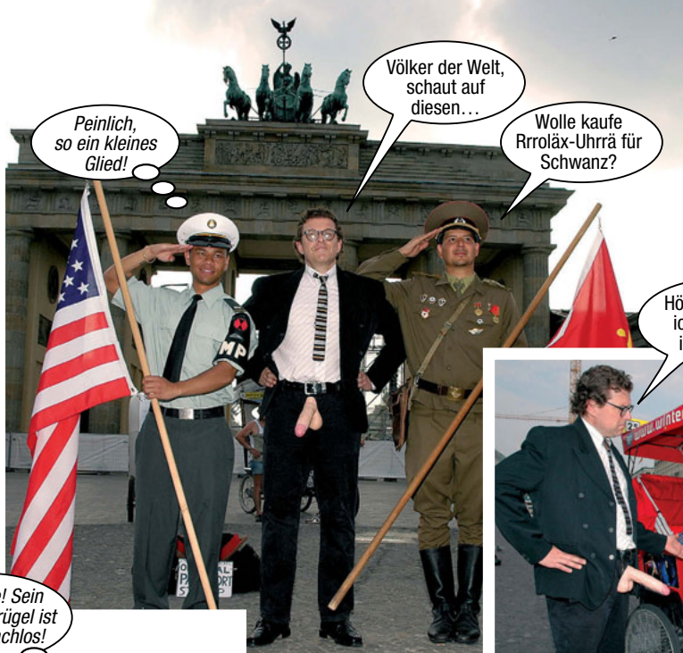
Peinlich, so ein kleines Glied!